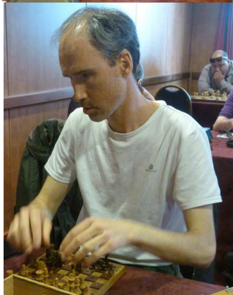
31eme Championnat de France des Aveugles Grille américaine après la ronde 7