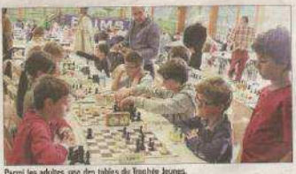
Parmi les adultes, une des tables du Trophée Jeunes.