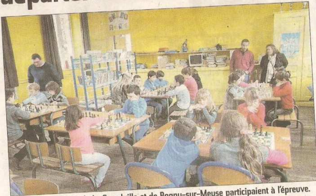
28 écoliers d'Asfeld, de La Grandville et de Bogny-sur-Meuse participaient à l'épreuve.