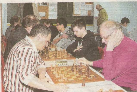
La première compétition de 2014 pour Reims Echec et Mat.