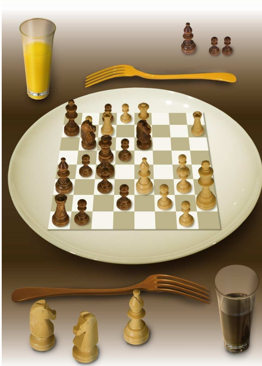
JC Camus 2014

(parc loisir, croisière, château) Tarif : 5€