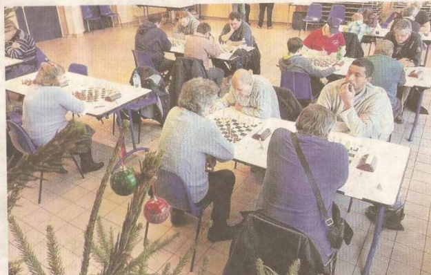
Les organisateurs ont salué les belles installations du centre social de Manchester