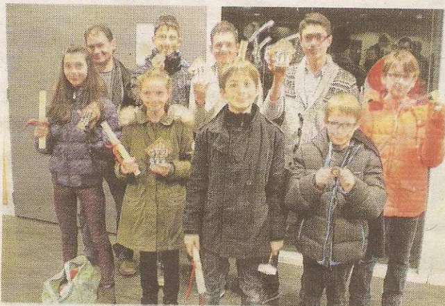
Les jeunes Rémois se sont imposés dans cinq des huit catégories.

Un beau cadeau de Noël pour le club « Reims échec et mat ». Douze joueurs se sont déplacés aux Championnats de ligue Jeunes d'échecs, organisés au Centre sportif de l'Aube à Troyes. Certains ont trusté les titres en s'imposant dans cinq des huit catégories. La rencontre a vu s'affronter les cinquante meilleurs joueurs régionaux de moins de seize ans. Ils tentaient de décrocher leur ticket pour les championnats de France jeunes qui auront lieu fin avril à Montbéliard.