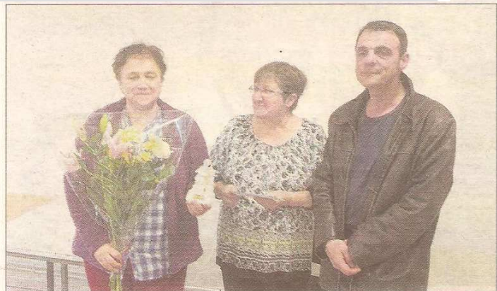
La joueuse internationale Viktoriya Schweitzer est arrivée troisième.