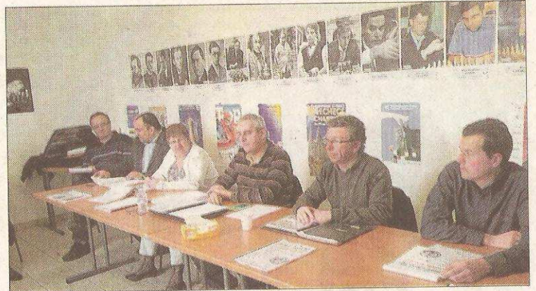
Le président fédéral a assisté à l'assemblée.

http://liguechaechechs.free.fr/compte%20rendu/saison%202014/Assemblee%20general%20de%20la%20ligue%20du%2015%20fevrier%20RECY.htm