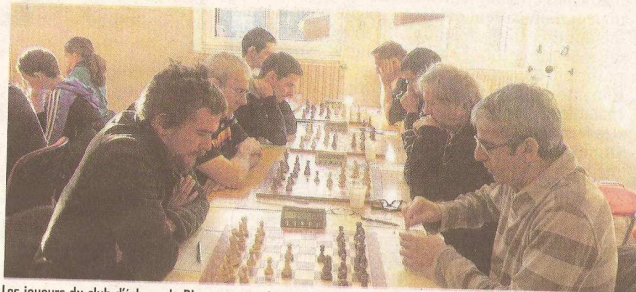
Les joueurs du club d'échecs de Blagny ont eu fort à faire face aux Rémois.